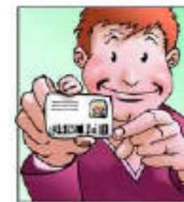
Documento + Carta Regionale dei Servizi del paziente

I documenti di riconoscimento possono essere in originale o in fotocopia.