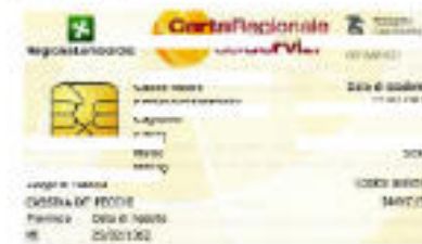
Carta Regionale dei Servizi